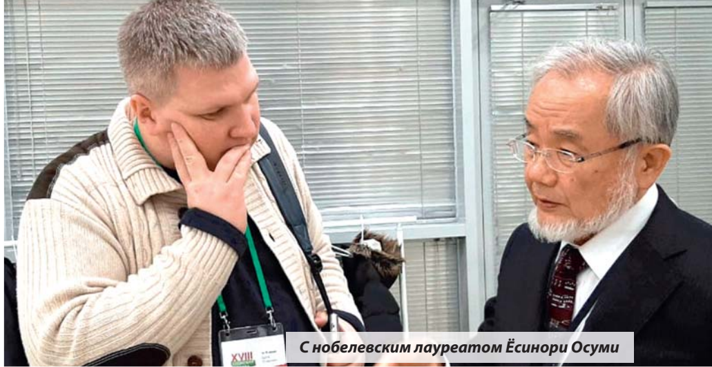
С нобелевским лауреатом Ёсинори Осуми

Во-вторых, рак очень адаптивен. Инновационные методы могут работать до определённого момента. У злокачественной клетки есть слабые места в виде