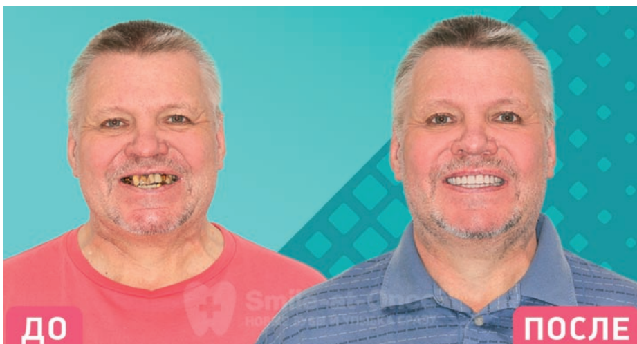
This is how patients change before and after dental implantation